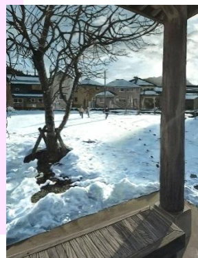
「16時、冬の公園」 絵画(油彩)

各校から3点まで、絵画・デザイン・立体造形・工芸分野に347点が出品され、姫路を会場に開催。(11/6～9)