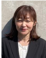
スクールソーシャルワーカー