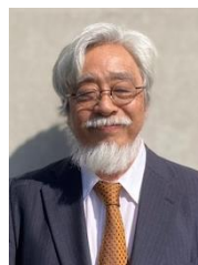
スクールカウンセラー