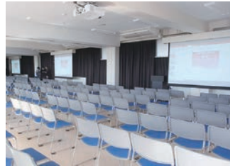
アクティブラーニング室