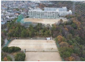
校舎とグラウンド

豊かな自然、広いグラウンド、最新の空調設備など、充実した学習環境が本校の誇りです。阪神間有数の新しく美しい教育環境の中で高校生活を送ることができます。