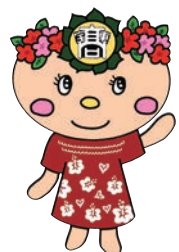
宝塚東高校 マスコットキャラクター ひがたん