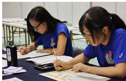
大会補助員（高校生活動）