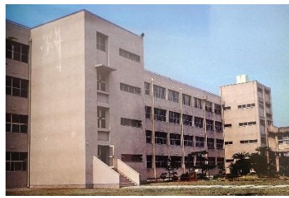
1978年（昭和53年）頃 校舎は鉄筋コンクリート になっていますが、渡り廊下がない！？現在のゼブ ンイレブン側に門があった ようです。