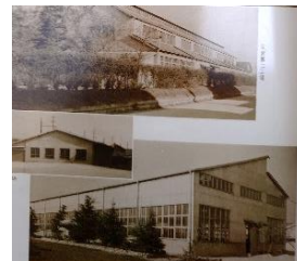
1962年（昭和37年）頃 校舎は木造 実習棟も小さいです。