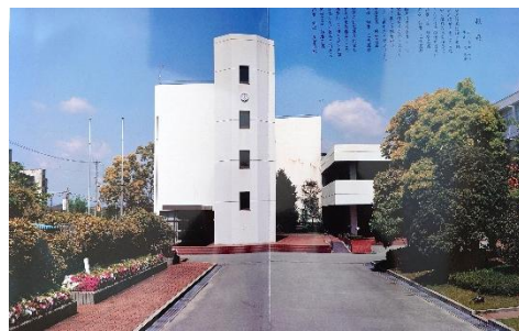
1996年（平成8年）頃 今から30年前には校舎も新しくなっています。でも、 現在とは何か違う…。現在駐車場になっている場所が 植え込みになっています。また、現在の図書室や大講義 室のある新館がまだありません。現在の新館の写真が 載っているのは2004年以降のアルバムでした。➡