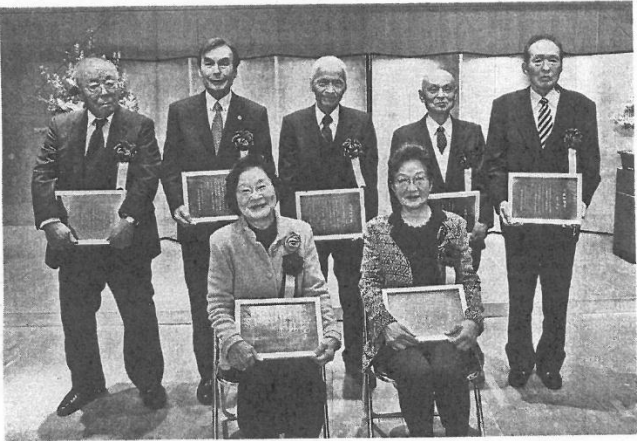
三宅剣龍賞とみどり賞の受賞者(丹波篠山市黒岡で)

【みどり賞】 ダンスユニット「桜珠」 ダンス大会で関西予選会3位、全国大会3位 西紀北小学校 「ふるさとひょう」SDG sスクールアワード2025」の小学校部門で最優秀賞 ホッケークラブ「HC HYOGO HEART S」 中学男子 近畿総体、全日本選手権 全日本都道府県対抗の3大会で優勝 篠山産業高校電気建設工学科測量班 「高校生もの