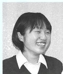
篠山産業高等学校 3年生