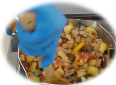
収穫野菜の加工実習