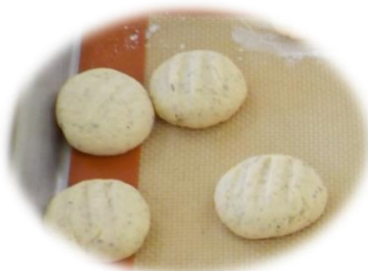
焼き菓子の加工実習