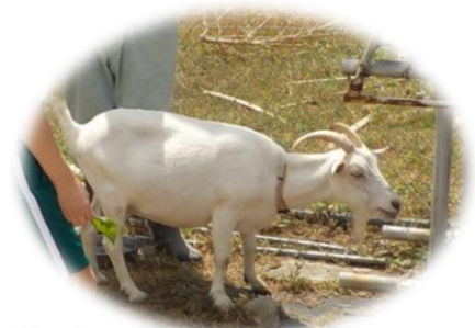
動物とのふれあい