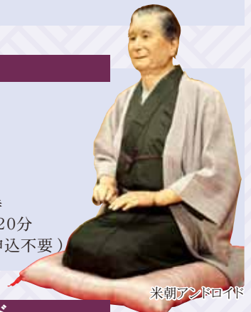
米朝アンドロイド