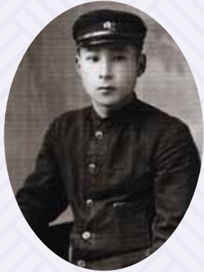
旧制姫路中学校の頃

この展覧会では、口演活動の記録、著作物、遺品および米朝アンドロイドなどを使って、昭和20年代から平成にかけて活躍したこの不世出の落語家の人物像に、芸能人としてだけでなく、文化人としての側面にもスポットを当てて迫ります。