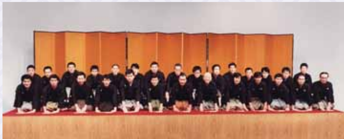
昭和61年正月米朝一門勢揃い