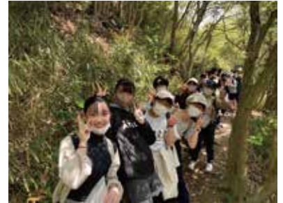
エンパワーメント・プログラム