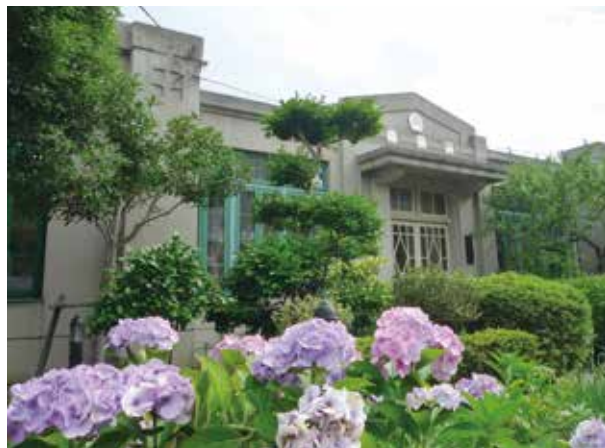
神撫会館（国の登録有形文化財）

長田高校卒業生に神撫会（長田高校同窓会）から贈られる卒業記念メダルです。刻まれた言葉は、ラテン語の格言 Ad astra per aspera に由来します。「困難を克服して栄光を獲得する」という意味で、Ad astra は「To the stars」「星に至らん」という意味をもちます。最上部にある星は、北極星。他の星は北斗七星を表しています。