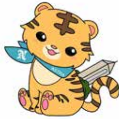
長田高校マスコット あすトラ

オーストラリア研修・佛山第三中学校 との交流・エンパワーメントは人気の プログラム。海外への夢を応援します。