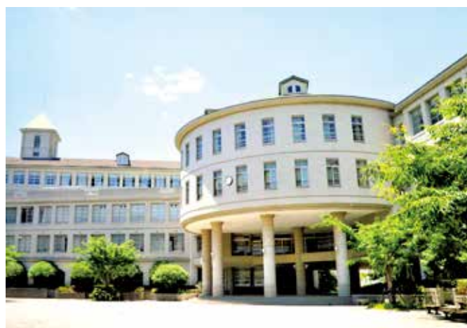
中庭から望む校舎