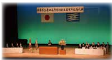
創立100周年 記念式典