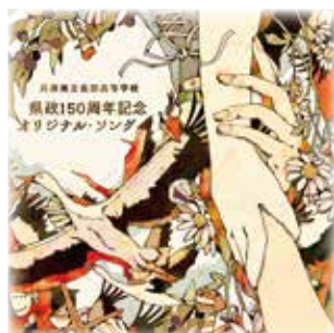
本校生が作詞・作曲した 県政150周年オリジナル・ソング CD (YouTubeにて公開中)

一、 尽きぬ荊蕀ぞ海に入れ 長田の宮の宮杜の 木木の秀枝と匂ひ立ち 歩みも遠く来は来つれ その名を負ひて学苑の 日に新しきいぶきかな 二、 風にいななく若駒が ひづめにしだく牧の野に 影を落として大ぞらを ゆく白雲のはるかにも おのづからなるすがたして あらむねがひのいのちかな 三、 仰ぐ神撫の峯高き 頂をさすみちの崎嶇 星に到らむのぞみもて 掲げつとむる学灯の 光がてらすあこがれの 夢多き身のわれらかな