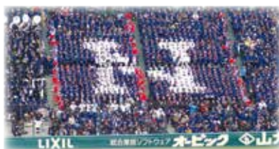
2016 春 甲子園出場