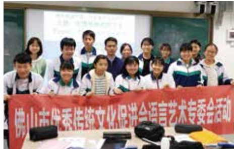
中国広東省佛山市第三中学校との交流

オーストラリア研修・佛山第三中学校 との交流・エンパワーメントは人気の プログラム。海外への夢を応援します。