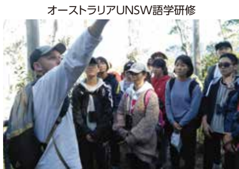
オーストラリアUNSW語学研修