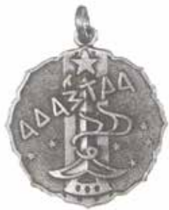
『Ad astra』アド アストラ

長田高校卒業生に神撫会（長田高校同窓会）から贈られる卒業記念メダルです。刻まれた言葉は、ラテン語の格言 Ad astra per aspera に由来します。「困難を克服して栄光を獲得する」という意味で、Ad astra は「To the stars」「星に至らん」という意味をもちます。最上部にある星は、北極星。他の星は北斗七星を表しています。