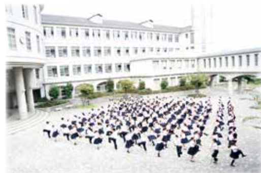
POCARI SWEAT CMIに出演