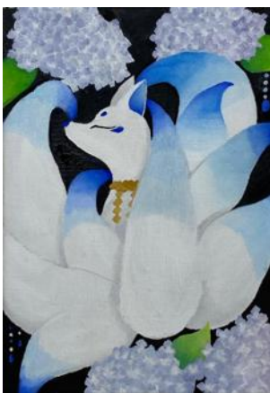
入選 3年次 吉田琉捺