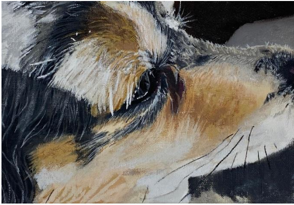
佳作 (3席) 3年次 松村美波