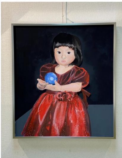
入選 3年次 池内瑠璃「写真撮影」