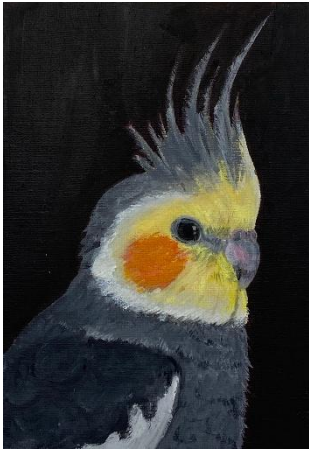
入選 3年次 池内瑠璃