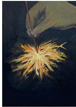
入選 3年次 井上実祈