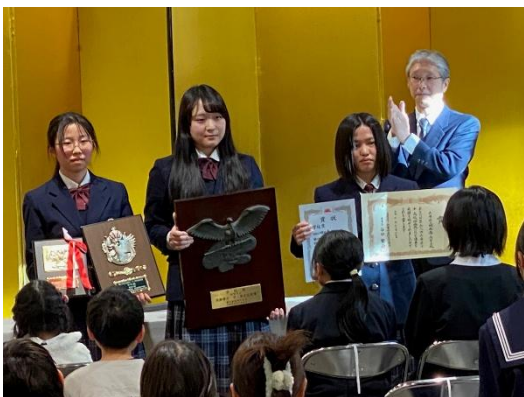
表彰式（大丸神戸店9階イベントホール）に出席しました。