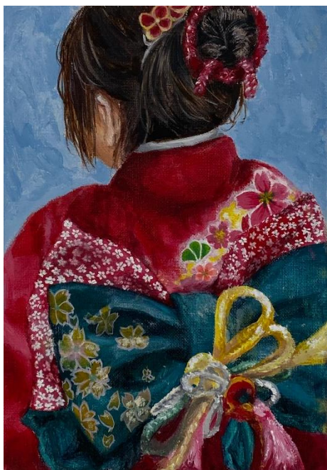
優秀賞（2席） 3年次 古瀬優実