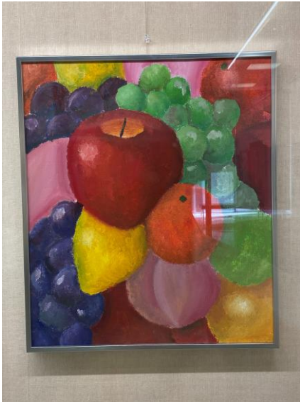
入選 3年次 原田拓真「十人十色」