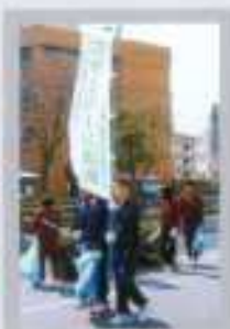
ボランティア活動