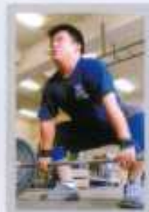
ウエイトリフティング部