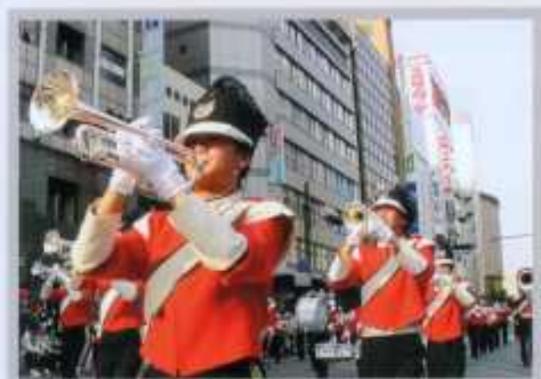
音楽部 (神戸祭パレード)