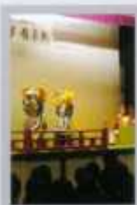
国際理解・発表鑑賞会