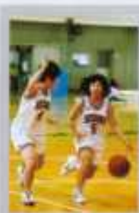
バスケットボール部