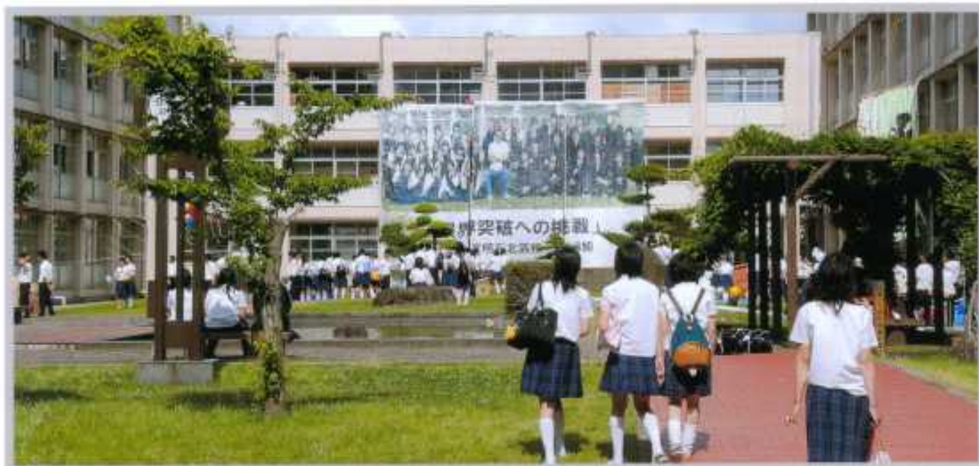
明北祭ビッグアート