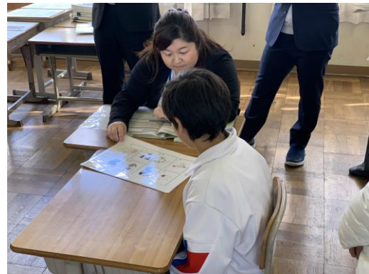
DLAを実施している様子