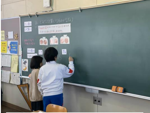
式や答えを黒板に書いている様子