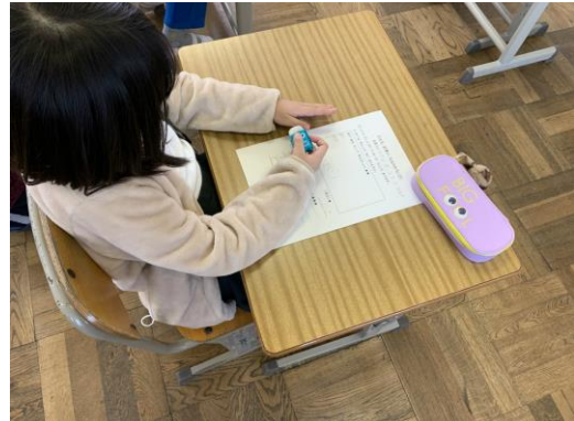
ワークシートに図や絵を描いている様子