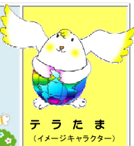
テラたま (イメージキャラクター)

ホームページ http://www.hyogo-c.ed.jp/~mc-center/