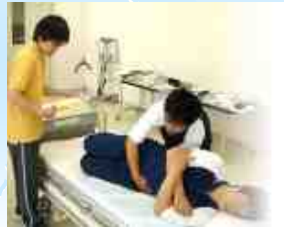
Jurusan kesejahteraan sosial