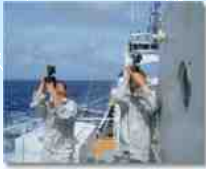
Jurusan sains kelautan