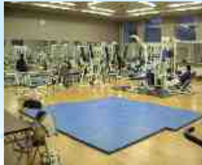
Physical Education Edukasyong Pangkatawan