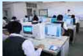
Komersyo • Kalakal