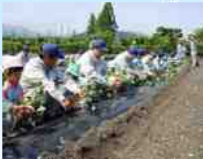
Kagawaran ng Agrikultura