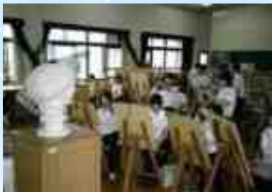
Kagawaran ng Sining