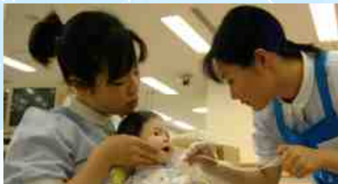
Nursing Department ( Departamento ng Narsing)