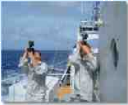
Marine Science Agham Pang marina