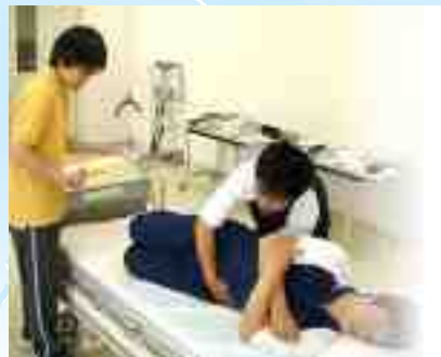
Kagawaran ng Kapakanan