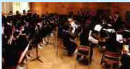
Kagawaran ng Musika