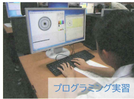
プログラミング実習

★大学での実験・実習・講義 (園田学園大学、甲南大学 理工学部・フロンティアサイエンス学部、武庫川大学 建築学部)