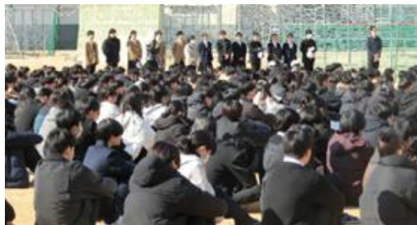
令和6年度3学期防災教育 ワークシート