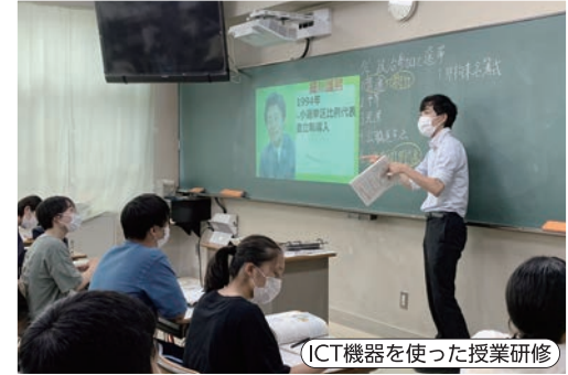
ICT機器を使った授業研修