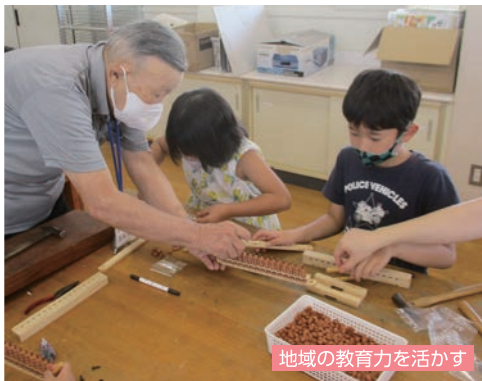
地域の教育力を活かす