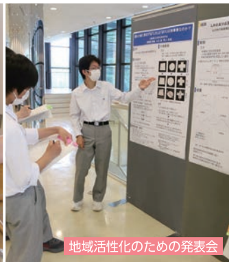
地域活性化のための発表会