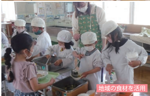
地域の食材を活用