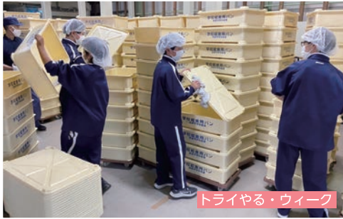
トライやる・ウィーク