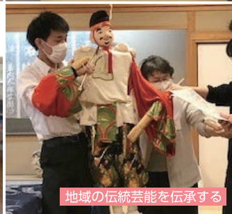
地域の伝統芸能を伝承する