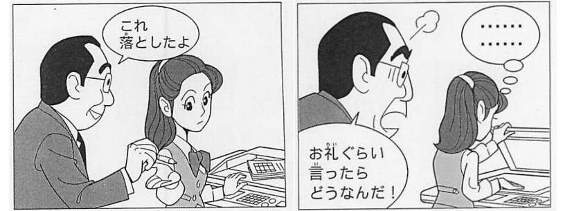
「見てわかるビジネスマナー集」(ジヤース教育新社)より