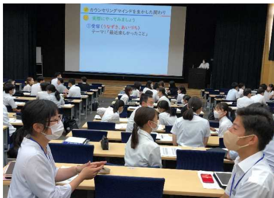
「傾聴の 5 技法」に取り組む受講者。体験を通して、うまずきやあいづちといった受容が話しやすさを生むことについて理解できました。