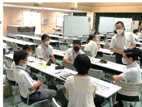
校種、職種を越えた班編制で演習を行い、情報交換や協議を行いました。