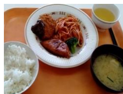
(日替り定食) コロケとミートミニオムレツ