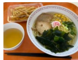
フライドポテト 塩ラーメン