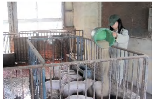
豚に飼料を与える