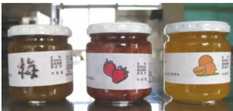
食品製造で作っているジャム

A2 作物・・・水稲栽培を基盤に野菜、大豆栽培 食品製造・・・ジャム製造(イチゴ・ウメ・ブドウ・オレンジ) 農業機械・・・エンジンの分解・組立、溶接・溶断技術の習得 畜産関係・・・鶏、豚、肉牛、乳牛の飼育管理と粗飼料(イタリアン・エン麦)栽培