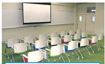
キャリアプランニングルーム

教卓の上には大きなミラーが付いており、実習に使う食材が後方の座席にも提示できるようになっています。