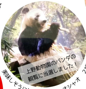
上野動物園のパンダの 観覧に当選しました！ 美味しそうに笹を食べるシャオシャオ