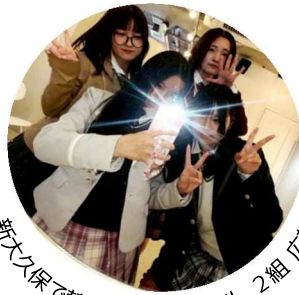
新大久保で韓国制服をレンタル