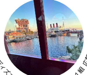
ディズニー内にある汽車の中から