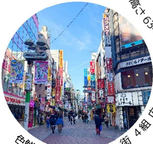
色鮮やかな渋谷センター街