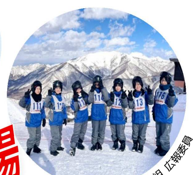
ゴンドラで行った山の上