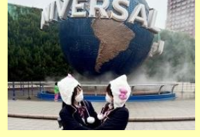
友達とキティちゃんお揃い