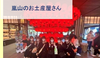
嵐山のお土産屋さん