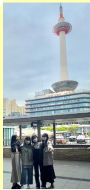
京都タワー前で記念写真

USJではアトラクションや、グッズ、パーク内のフードなど、新しいクラスでのグループごとに楽しみました。