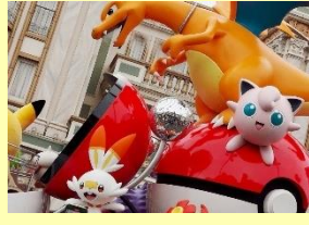
リザードンの口から煙がモクモク