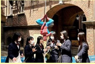
写真のポーズ考え中