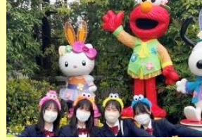
セサミのカチューシャをみんなでお揃い