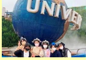
ユニバーサルグローブ