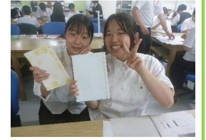
苦戦したけれど、いい思い出になりました！ ★ 出来上がりです！

〈感想〉難しい作業で完成できず悔しい思いをした人もいますが、経験できて「楽しかった！」という感想がほとんどでした。講師の先生のご指導のもと、楽しいひと時を過ごせたことに感謝します。