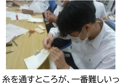
本物を見せていただきました ☆ 糸を通すところが、一番難しいっ！