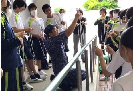
ロープワーク体験