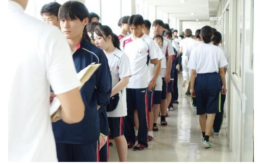
クラスごとに整列・点呼