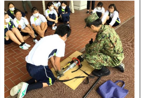
油圧式カッター体験