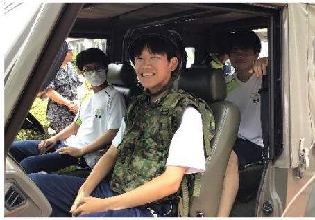
自衛隊班 パジェロ乗車体験