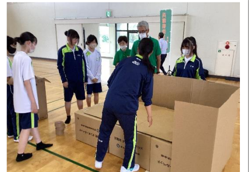
仮設物班 段ボールベッド組み立て体験