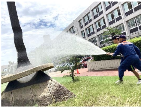
消防班 屋内消火栓の使用体験