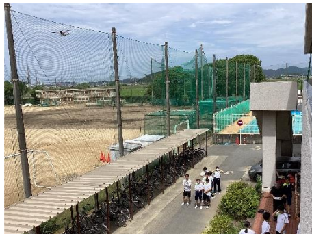
情報収集・伝達班 ドローン操作体験