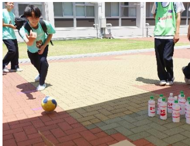
2-5 Round5 コロコロごくみーず(十佳戯)