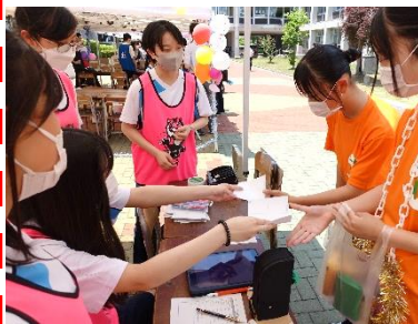
2-3 ファインディング・ヒト