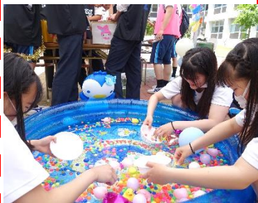
2-2 おいでや ～スーパーボールすくい～