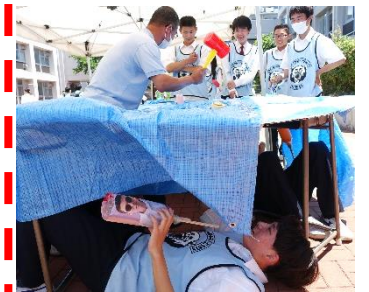
2-4 Happy whack-a-mole