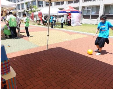
2-6 Breaking Kick