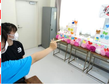
1-1 にしくんとあそぼ!!