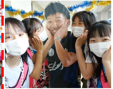
1-2 スーパーつばさ ブラザーズ☆