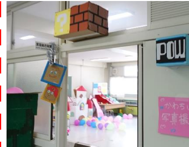
1-5 スーパーマリオ ワールド