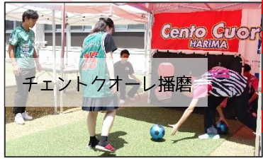
チェントクオーレ播磨