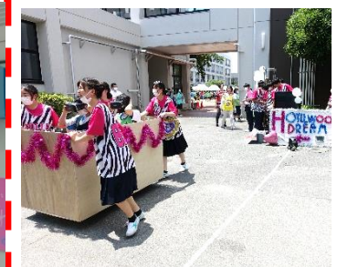
1-6 ハリウッド南楠祭! USJより1-6ドリーム