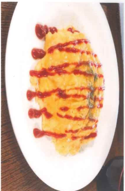
ふわとろオムライス 450円