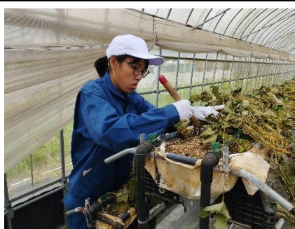
いちごの根引き作業