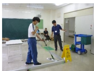
ビルクリーニング