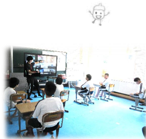
修学旅行事前学習