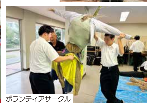
ボランティアサークル