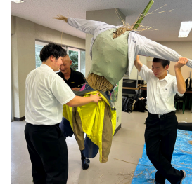
ボランティアサークル