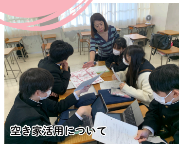
空き家活用について