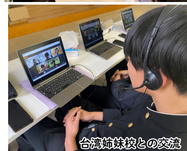
台湾姉妹校との交流