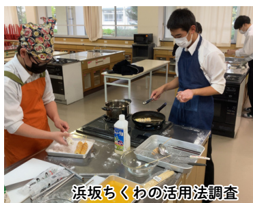
浜坂ちくわの活用法調査