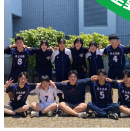
男子バレーボール部