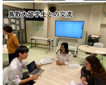
鳥取大留学生との交流