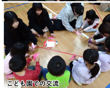
こども園での交流