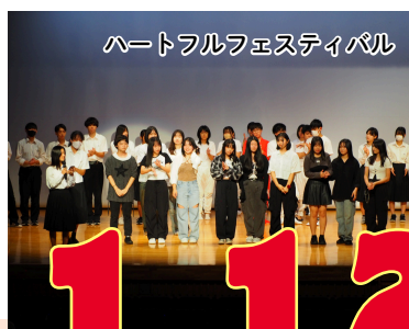
ハートフルフェスティバル