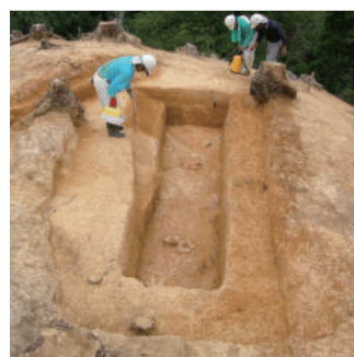
和泉谷・津原古墳群