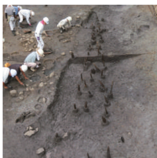
小垣谷古墳群 小垣谷遺跡