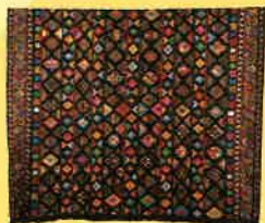
女性用衣装(キラ) (絹、木綿、金属糸、20世紀後期)

【民族衣装の流れ】自給自足率の高い生活を誇るブータン。地域毎に独自の織物文化が息づいている。【装身具と生活】着道楽が多いブータンの女性の衣装には、トルコ石を象徴した銀製ブローチが不可欠。