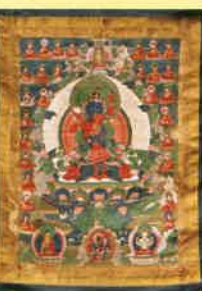
ドルジ・チャン父母仏タンカ (綿本彩色、17~18世紀末期)