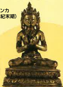
ドルジ・チャン坐像(銅造、17世紀)