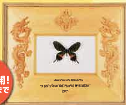
国蝶ブータンシボリアグハ(標本、特別展示)