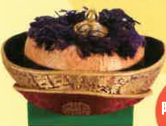
初代国王ウゲン・ワンチュクの帽子 (金綱、鍍金された銀、20世紀)

初代国王ウゲン・ワンチュクから現国王ジグミ・ケサル・ナムギャル・ワンチュクまでのブータン王室の衣装などを特別展示。