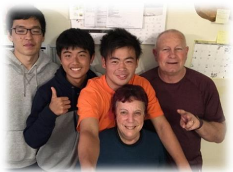
ジョーク好きなパパにいつも笑わされました

オーストラリアの動物やオーストラリア英語をクイズ形式 で学びました。とても楽しかったです。天気が良かったので外 に出て伝言ゲームをしました。“were pants”が“water pants” になっていて先生と一緒に大笑いしました。