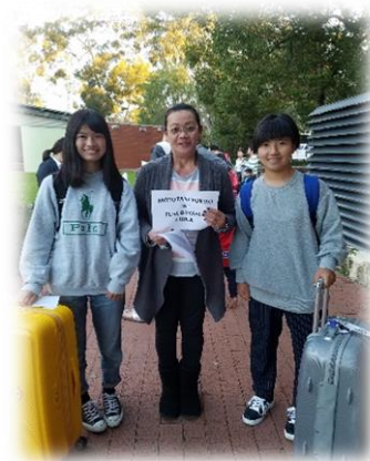
オーストラリアに家族ができたみたい！