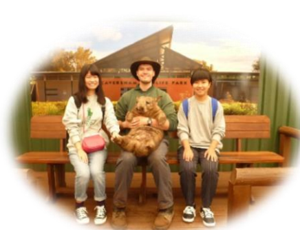
足にタッチしたよ