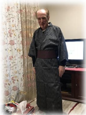
お父さんに浴衣を着せてあげました！