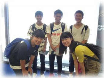
Bye for now, Japan!!