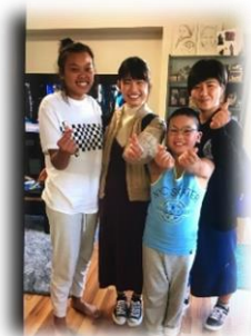
ママの妹の家族と！