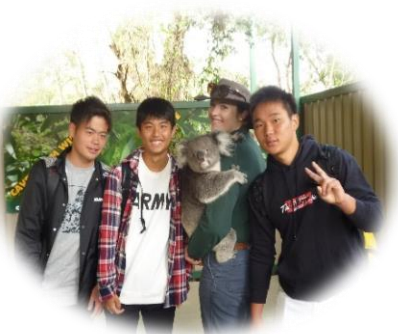
パークで一番美人なコアラと