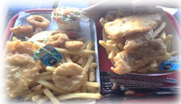
Fish & Chips! Yummy!!