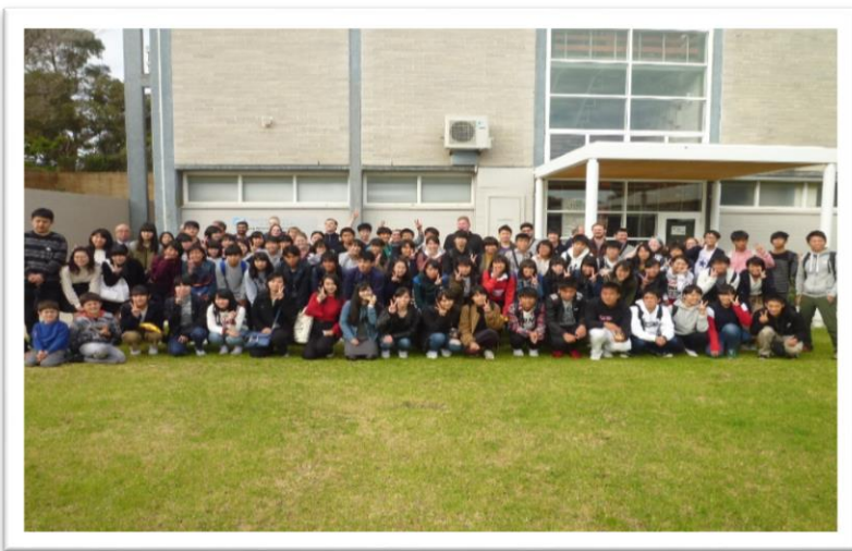
兵庫文化交流センター前で