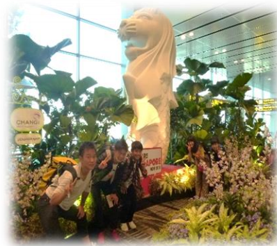
マーライオンのオブジェと