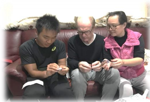
お父さん、お母さんと折り紙を折ってみた！

放課後、パース市内を探索しました。とてもおしゃれな街でワクワクしました。お土産をたくさん買いました。オーストラリアで初めてバスに乗りました。運転席が檻みたいになっていました。