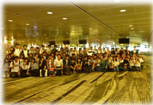
シンガポール空港でランジット