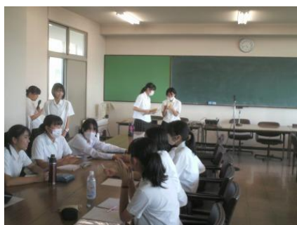
オーディション準備中

さて、体育大会です。今年は例年通りとはなりませんが、放送部の役割は変わりません。今年の体育大会のスローガンは“至誠一貫～乗り越えたものだけが勝利を掴む～”です。放送部は、まさにスローガン通り、準備・進行と体育大会が参加者にとって“良い思い出”となるように取り組みました。それにしても、不安定な天候の中、予行も本番も開催することができ良かったです。次は美術科体験入学会です。