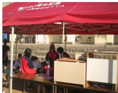
体育大会予行準備完了