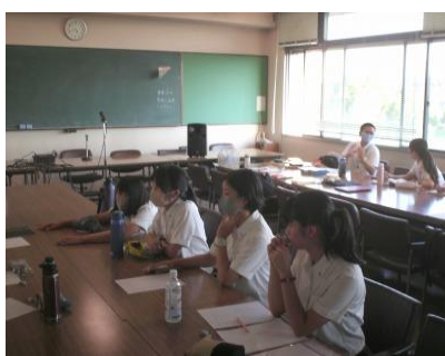
オーディション審査中