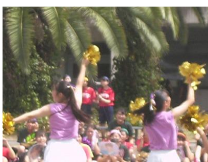
ダンス部演技収録中