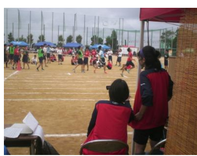
リレーも収録しています。