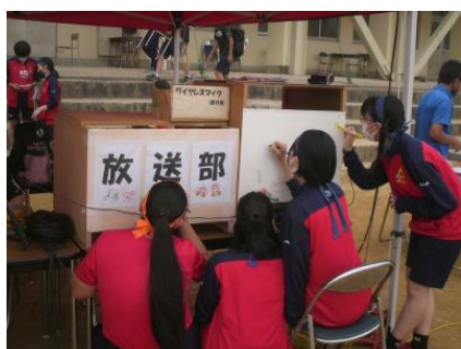
看板に表現を加えてみました。