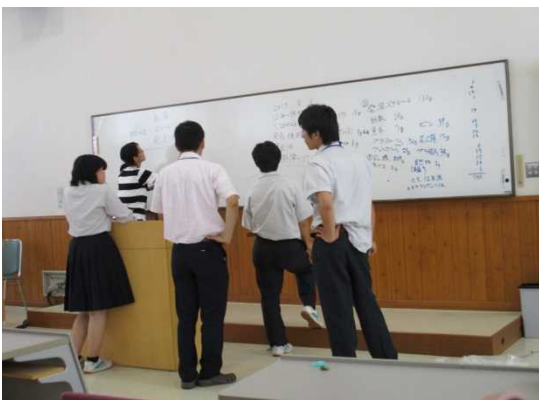
ゴミの調査結果の集計