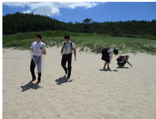
琴引浜のゴミの調査回収