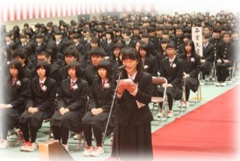
卒業生代表の答辞

天候にも恵まれ、感動に包まれた卒業式となりました。巣立っていく第70回生199名の益々の活躍を心より願っています。