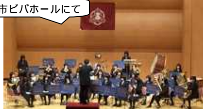
養父市ビバホールにて