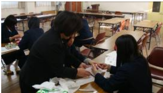
ハンドマッサージをしてみました