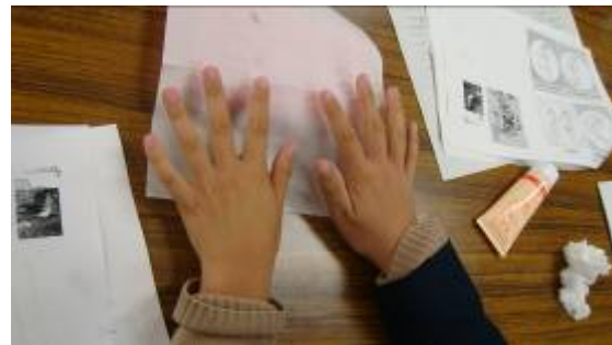
変化はあったかな？