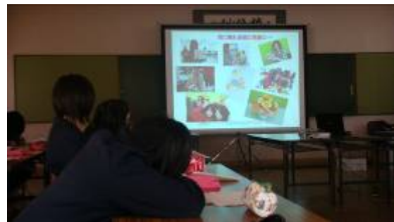
介護を目指す学生の様子