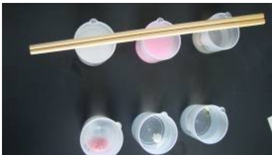
薬の溶け方はどうだろう