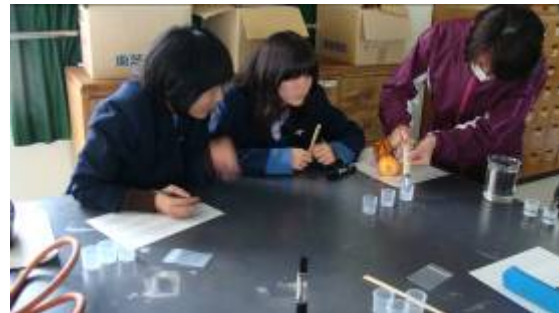
薬に溶液を入れてみました