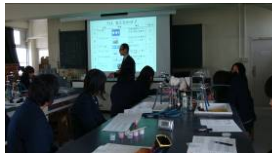
最後に小テストと答え合わせ