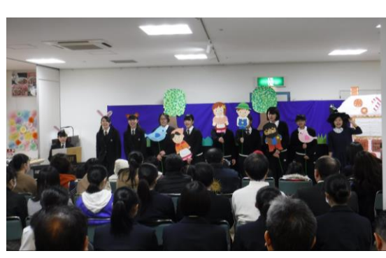
たくさんの方にお越しいただきました