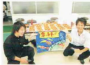
生活体験発表 西播但馬地区大会