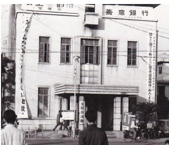
初代市役所 (旧良元村役場)

私たちが住んでいるこの宝塚市は元々武庫郡の川面村・美佐村、川辺郡の安倉村・小浜村・米谷村・安場村でした。1885年川面村が安場村を合併し、1889年川面村、美佐村、安倉村、小浜村、米谷村が合併し、川辺郡小浜村となりました。1951年小浜村が町制を施行して宝塚町となりました。1954年には良元村と宝塚町が合併し、宝塚市が成立しました。その後、1955年に長尾村と西谷村が編入され、鴻池、荒牧、荻野は宝塚市から伊丹市へ編入され現在の市域となりました。