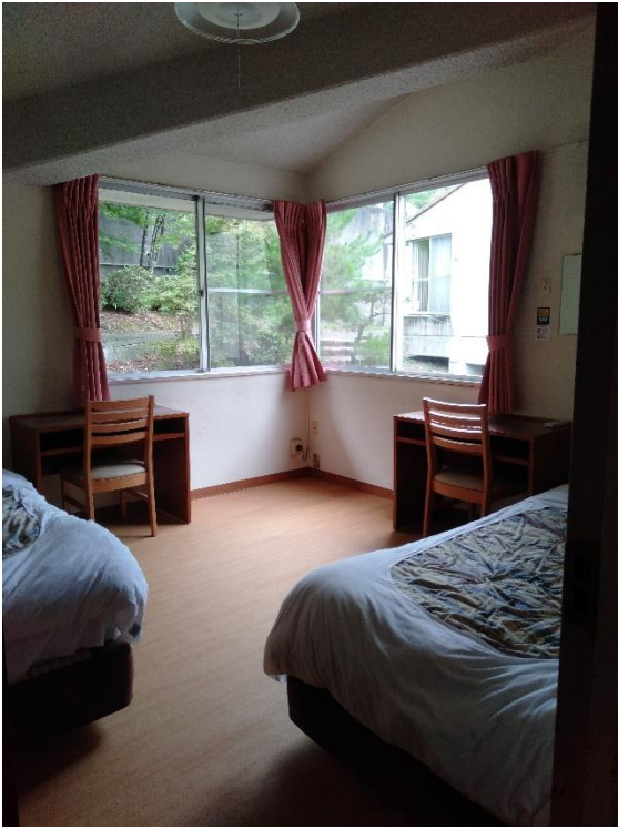
お部屋の中。 コロナ対策でこの部屋を1人で使う予定です。