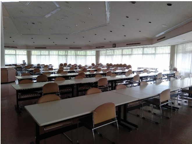
食堂。向かい合わないように少しずらしてあります。