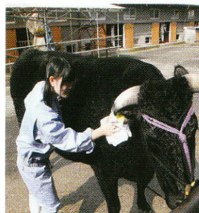
肥育牛の出荷準備