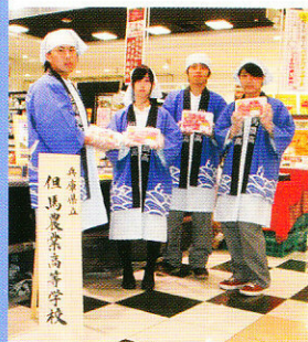
バナナパイナップルの販売