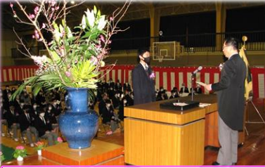
卒業証書授与 みなのりと食科 代表