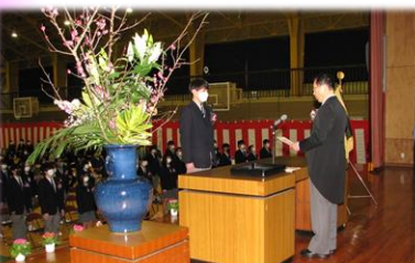
卒業証書授与 総合畜産科 代表